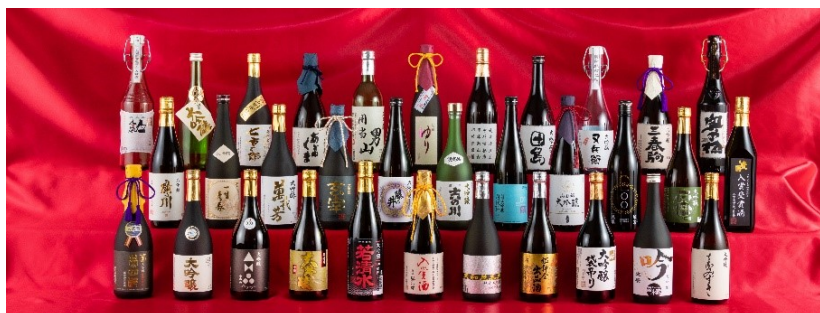
Na Premiação Nacional do Melhor Saquê do Ano 2019 foram classificadas 33 marcas. ( Não foi especificada o Saquê Prêmio Ouro devido ao impacto do novo coronavírus, foi realizada somente a anúncia dos saquês classificados).

O Saquê de Fukushima é um dos produtos de marca da província. Porém, na época do Grande Terremoto do Leste do Japão muitos fabricantes (shuzo) foram danificados ou foram obrigados a deslocar dos lugares de origem de fabricação. O lançamento de novas marcas de saquê foram divulgadas no Concurso do Melhor Saquê do Japão, conquistando o melhor prêmio e transmitindo a virtude da marca do produto da província. Estas conquistas consecutivas do Prêmio Ouro, o 1º. lugar do fatores que contribuíram para afastar os rumores, a preocupação dos consumidores em relação aos produtos de marca 「Produzido na Província de Fukushima」. O saquê de Fukushima marcando o recorde pela premiação de Melhor Saquê Nacional por 7 anos consecutivos. Atualmente é considerada a grande expectativa pela divulgação da sua alta técnica e qualidade, apagando a imagem negativa dos rumores e proporcionando a abertura do mercado para produto em geral da província.